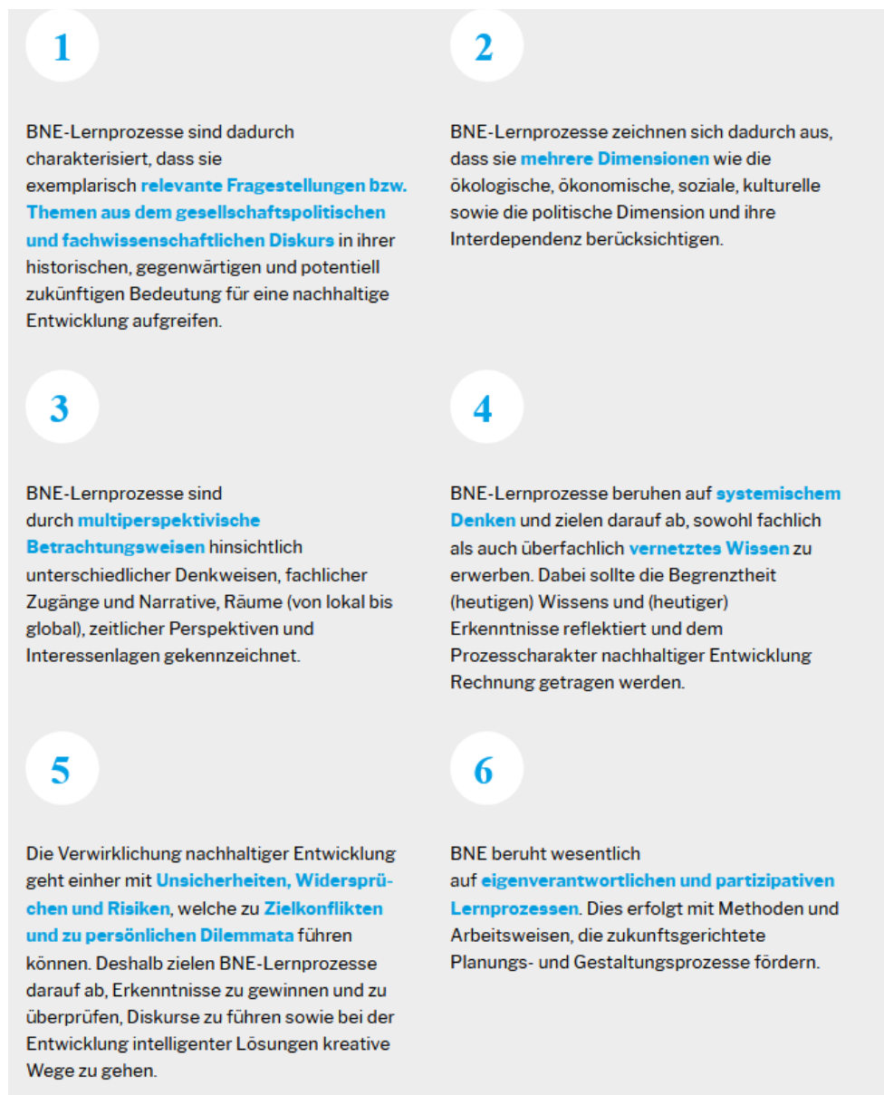
Abbildung 1: Merkmale von BNE-Prozessen, Quelle: https://www.bne.nrw/bildungsbereiche/schule/leitlinie-bne-alt/kapitel-2/#c2768 (2.2)

Im Bereich der Unterrichtsentwicklung identifiziert die Leitlinie die folgenden sechs Merkmale von BNE-Lernprozessen, die „Lehrerinnen und Lehrern eine Orientierung für die Gestaltung von Lehr-Lern-Prozessen anbieten“ 26 sollen: